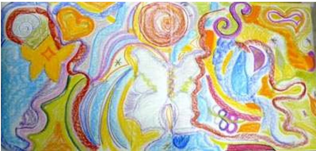
Œuvre collective réalisée à 3 personnes.