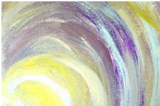
Détail d'une peinture de Cécile