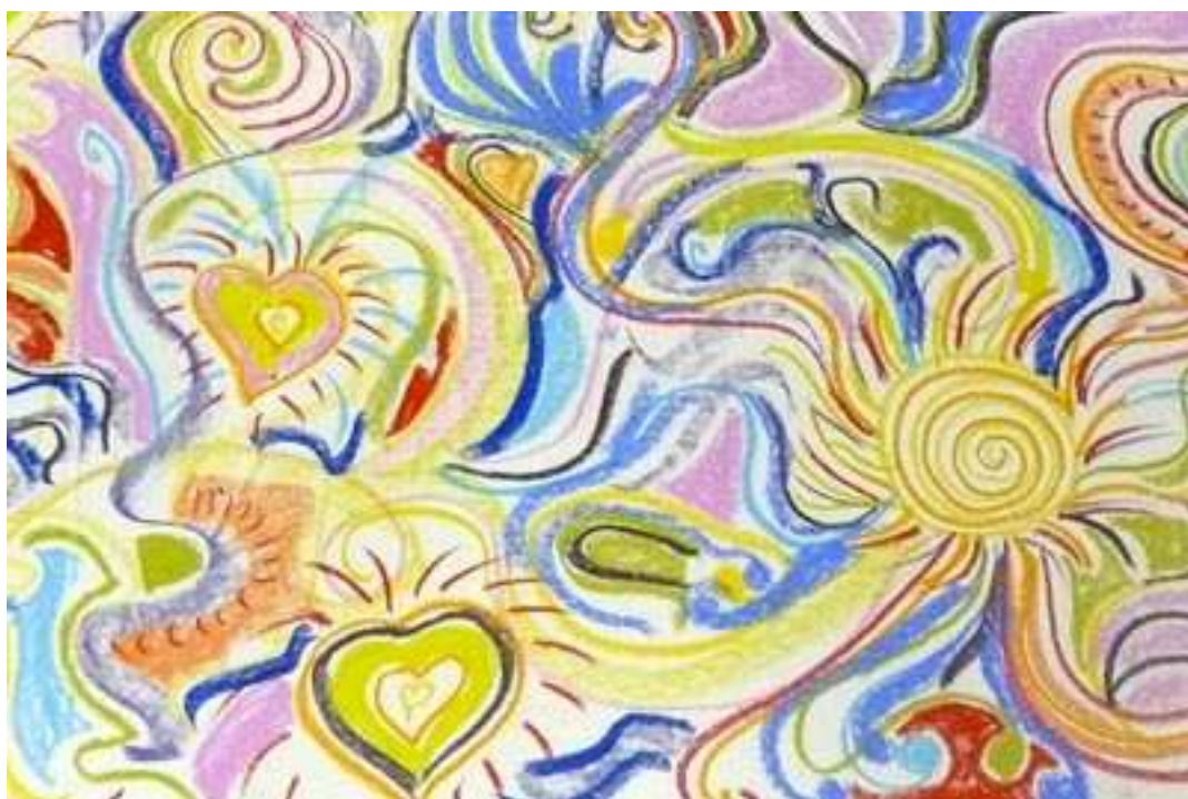
Détail d'un dessin collectif