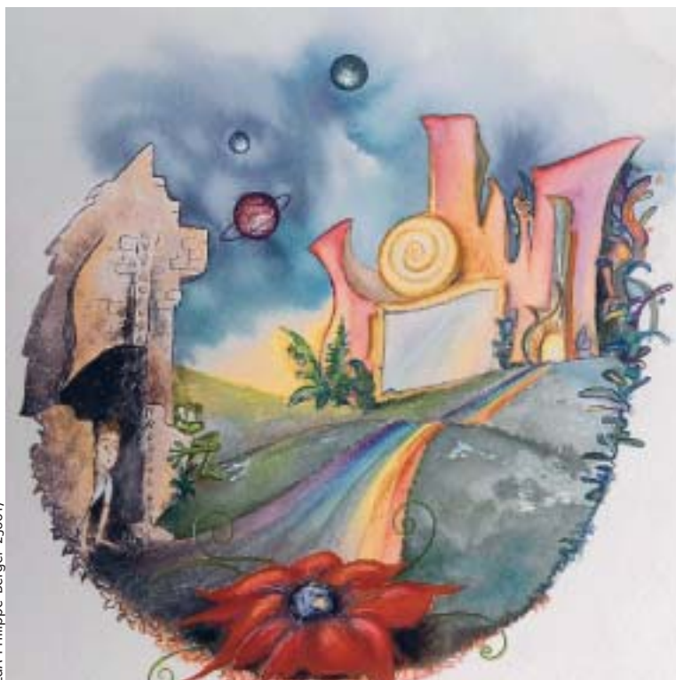
L'illustration de la page de garde du «Rayon rouge».