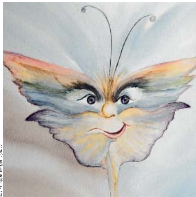
Le Mage Gody, papillon aux couleurs de l'arc-en-ciel, est un grand sage.