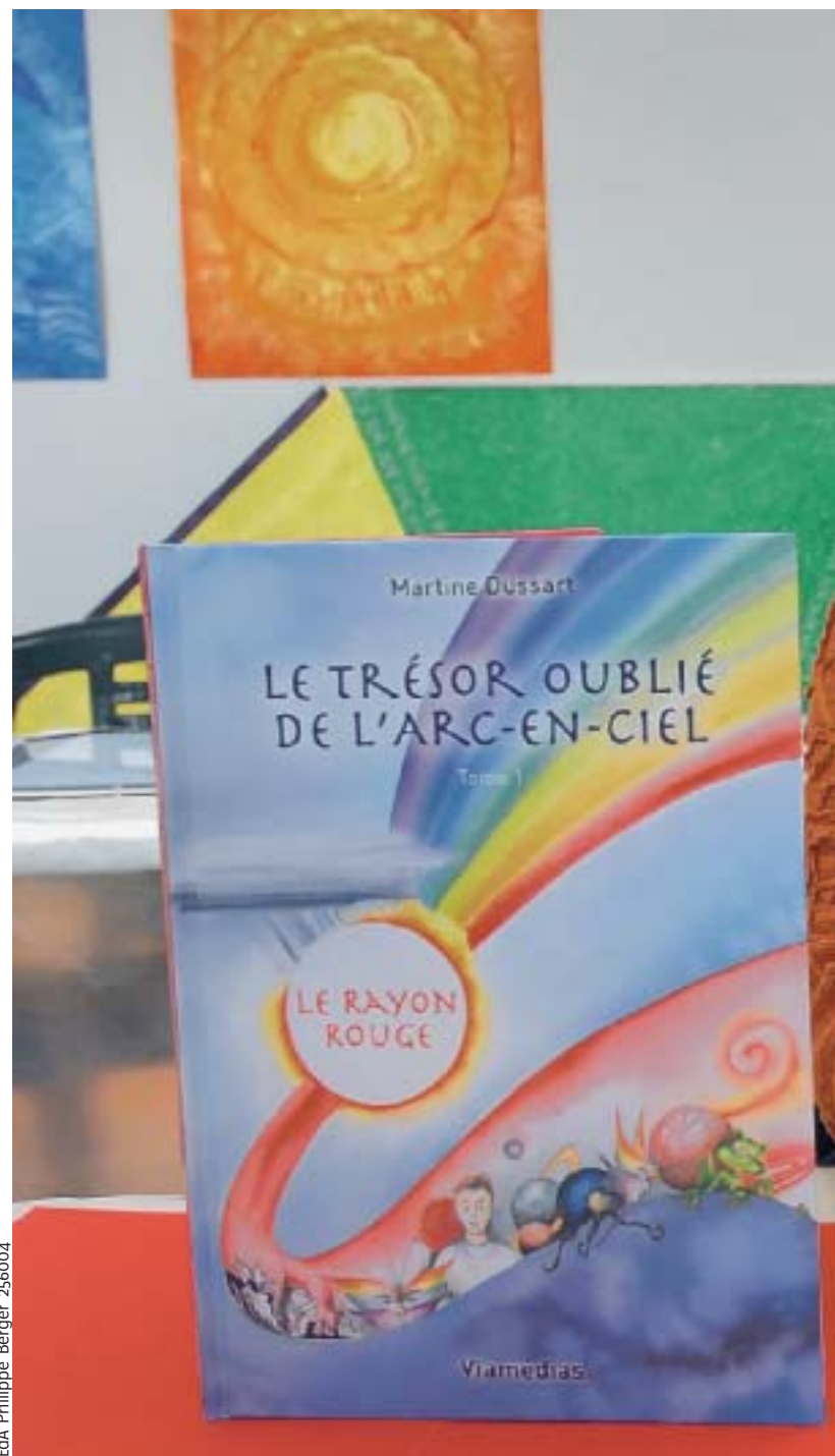
ÉdA Philippe Berger 256004

«Le rayon rouge» est le premier épisode d'une longue aventure qui emmènera le lecteur, de découverte en découverte. Au rouge, succéderont l'orange, le jaune, le vert, le bleu, l'indigo, le violet... et enfin l'arc-en-ciel, «monde invisible auquel Sancha peut demander de l'aide et qui le protège. Il part découvrir les familles d'âmes qui peuvent le secourir. Les différents Sô (médailles) qu'il aura reçus lui permettront d'ouvrir les sept portes menant au temple et au trésor.» ■